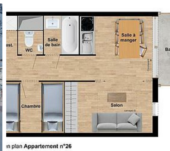
in plan Appartement n°26